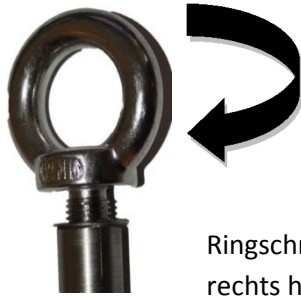
Ringschraube rechts herum

2) Zahnscheibe und Ringschraube mit Schraubensicherung hochfest (z.B. Loctite) einkleben und eindrehen.